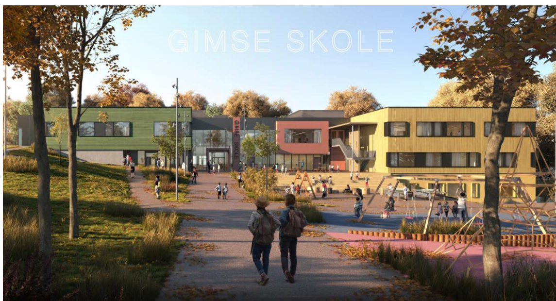
Figur 1: Illustrasjon over ny skole fra forprosjekt

Det er gjennomført en konkurranse om en totalentreprisekontrakt med samspill, med forutgående prekvalifisering av potensielle tilbydere. Fire entreprenører med tilknyttet arkitekt ble prekvalifisert for å konkurrere om totalentreprisen. HENT vant denne og samspillsprosessen. Det er planlagt ferdig forprosjekt som grunnlag for totalentreprisekontrakt innen mai 2020.