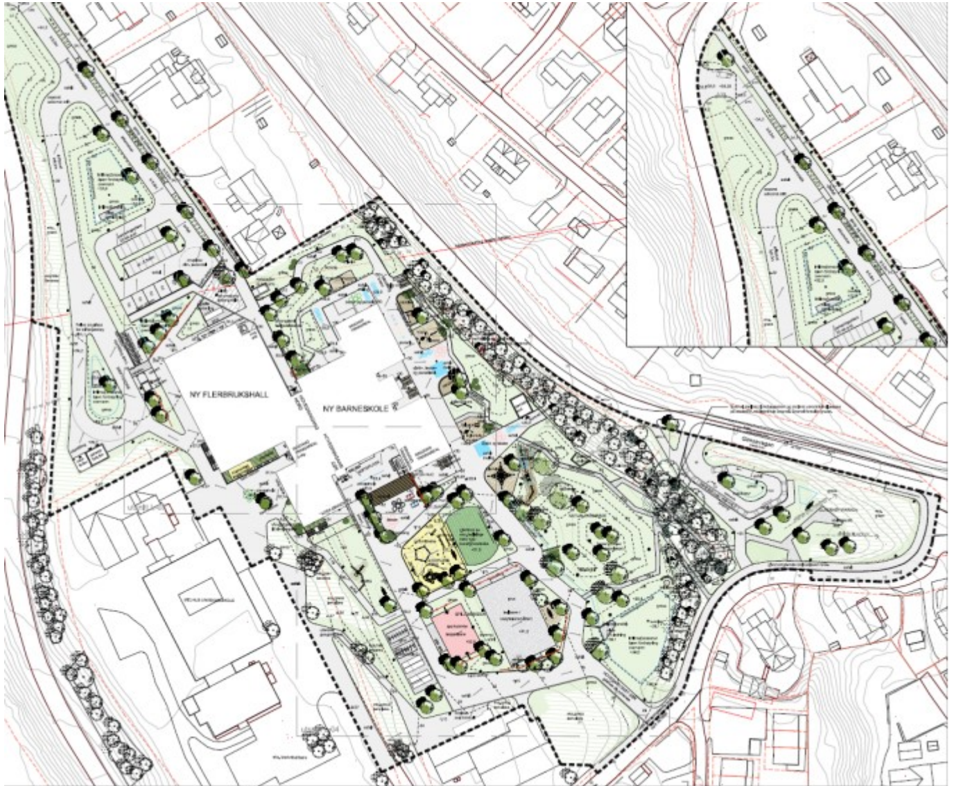
Figur 2: Landskapsplan for Gimse barneskole.

Forslag til planområde ligger innenfor Områdeplan for Melhus Sentrum (planID 2016001) og samsvarer i hovedsak med planformålene innenfor denne. Arealene er i hovedsak avsatt til T1 (Offentlig eller privat tjenesteyting), veg, gang- og sykkelveg, kollektivholdeplass og boligbebyggelse.